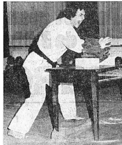
Une démonstration spectaculaire qui a fait grande impression: la casse-schiwari par l'entraîneur du Karaté-Club du vallon de Saint-Imier, M.