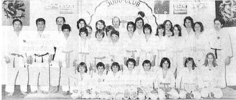
La grande famille du Judo-Club Saint-Imier (manquent certains membres).

d'une façon toute particulière à l'extérieur et employé été comme hiver!