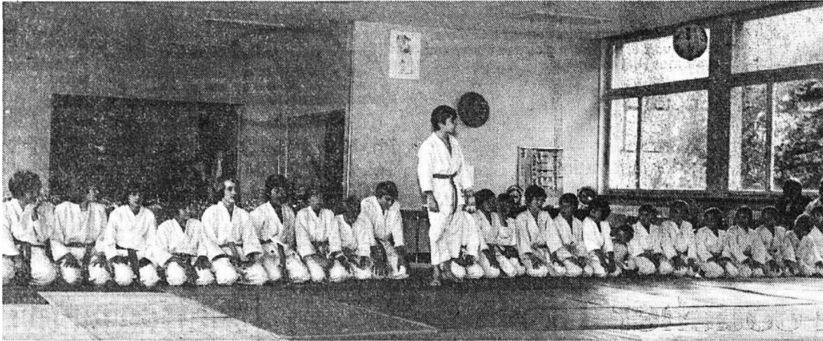
La relève est impressionnante au Judo-Club Saint-Imier.

Sans tambour, ni trompette le Judo-Club de Saint-Imier a fêté ses vingt ans d'activités samedi dans son magnifique dojo de la rue du Pont. Plus de septante personnes ont apprécié à leurs justes valeurs, les démonstrations effectuées par les jeunes de la société samedi après-midi. En soirée un repas servi dans le local a marqué cette majorité atteinte grâce à l'enthousiasme et la bonne volonté manifestée depuis 1961 par les différents responsables. Ces derniers ne manquent pas de dynamisme et souhaitent pouvoir augmenter leurs effectifs (chez les enfants, les adultes et dans la section gymnastique) d'ici le vingt-cinquième anniversaire.